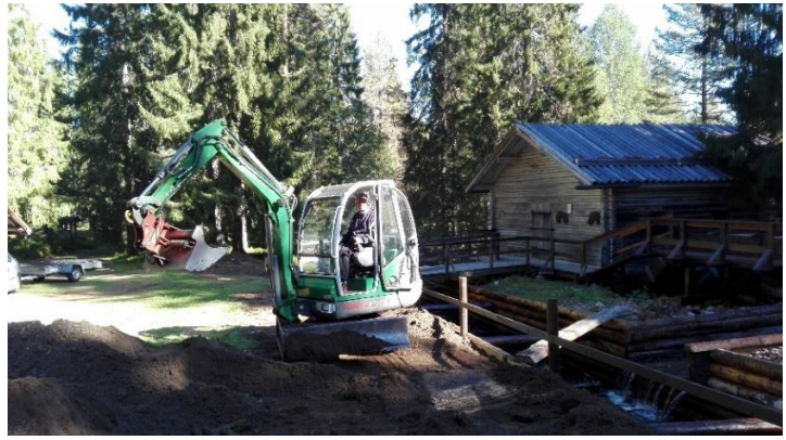
Tage Olsson fyller på med grus intill huvudrännan