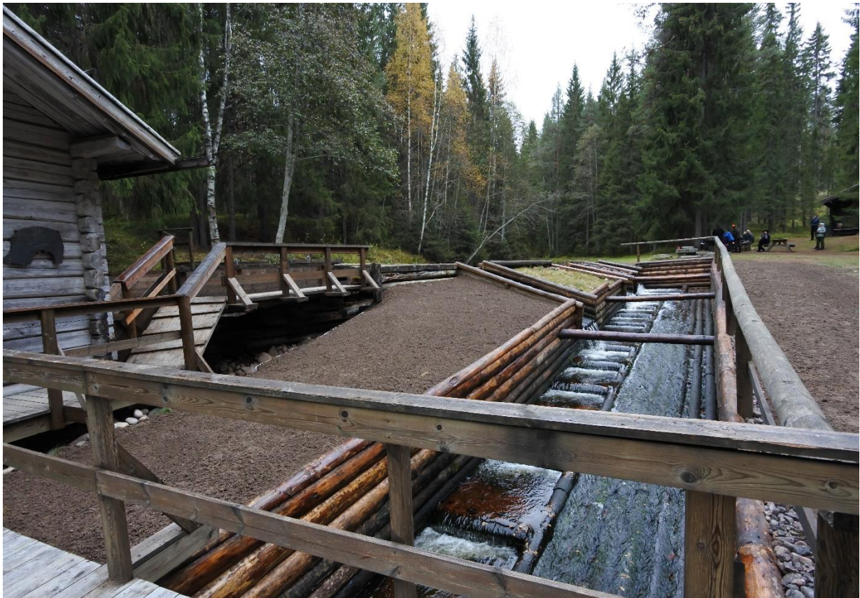
Axi kvarn efter restaureringen 2015–16