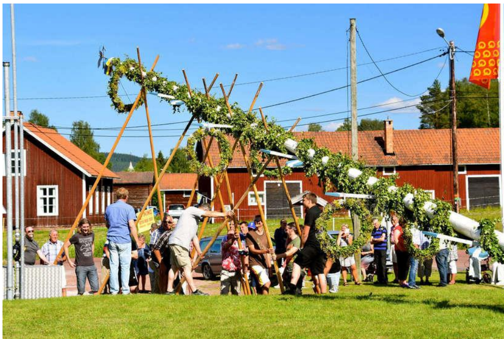
Majstången så sakteliga på väg upp. Tv i bakgrunden Missionshuset, där midsommararrangemanget avslutades med fika