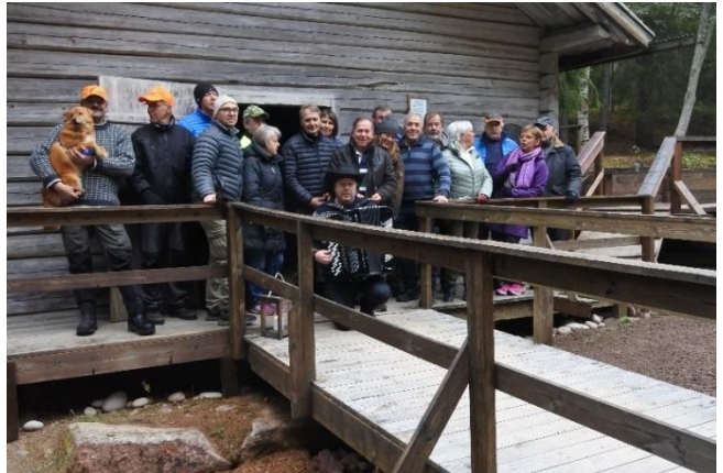
Besök av delar av jaktlaget m fl i slutskedet av renoveringen