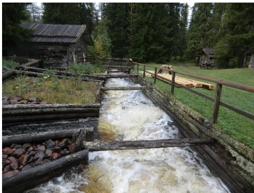
Utgångsläget innan utbytet av halvkluvorna

I upprustningsarbetena som kom igång i september 2015 bidrog hembygdsgörelsen inledningsvis med eget arbete i form av bl a demonteringsarbete och bortforsling av material. Sedan struligheter med materielleveranser mm gjort att upprustningen inte kunde slutföras med anlitad entreprenör under hösten fortsatte arbetet under 2016 i egen regi med utbyte av kluvor i rämnorna, markarbeten, tillverkning och installation av ”kwennkall” mm.