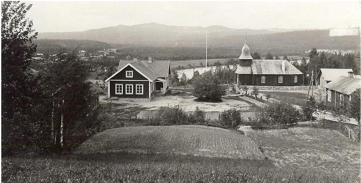
Småskolan och kapellet omkring 1920

Några fotografier från Oxberg som är inlagda i Bygdeband: