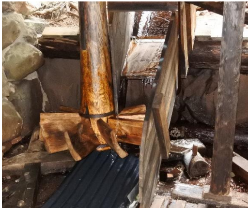
Att byta ut en "kwennkall" har har ingått i projektet