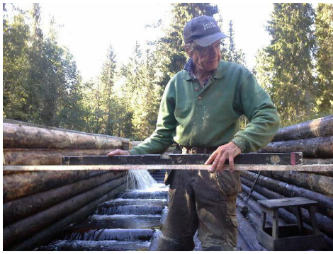
Mats jobbar i rännan