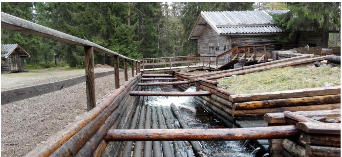
Timrings- och snickeriarbetena färdiga. Vid fotograferingstillfället återstod påfyllnad av jord i utrymmena mot dammen