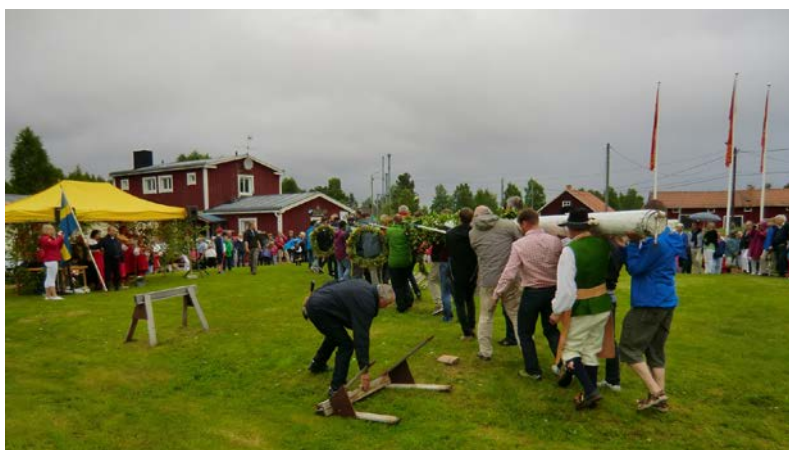
...medan den hittillsvarande stången efter reparation användes vid firandet 2013